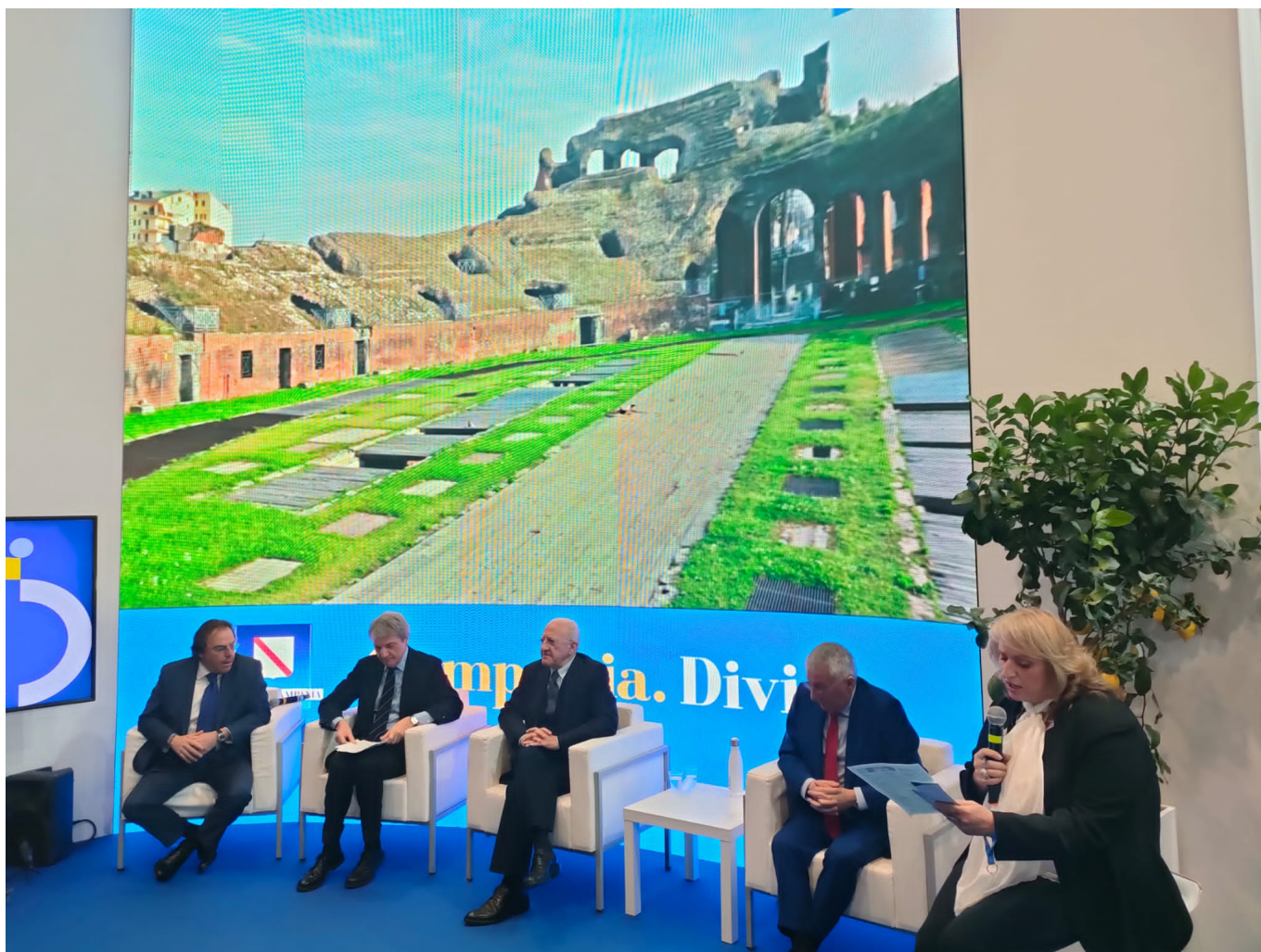
La conferenza stampa

Tra le tendenze in corso nella provincia di Salerno: L'enogastronomia, l'ospitalità locale e la qualità delle strutture di alloggio sono gli elementi più apprezzati dai turisti italiani e stranieri che visitano la provincia di Salerno; l'efficienza dei trasporti locali appare migliorabile. Al terzo trimestre del 2023, le registrazioni di imprese turistiche sono aumentate dell'1,9%, quasi 300 unità ; mentre gli addetti della filiera sono diminuiti del 3,6% rispetto allo stesso periodo del 2022. Si amplifica il fenomeno Airbnb, sia in termini di quantità di strutture (agosto 2023/22: +13,6%) , sia per volumi economici generati (gennaio-settembre 2023/22: +32%) .