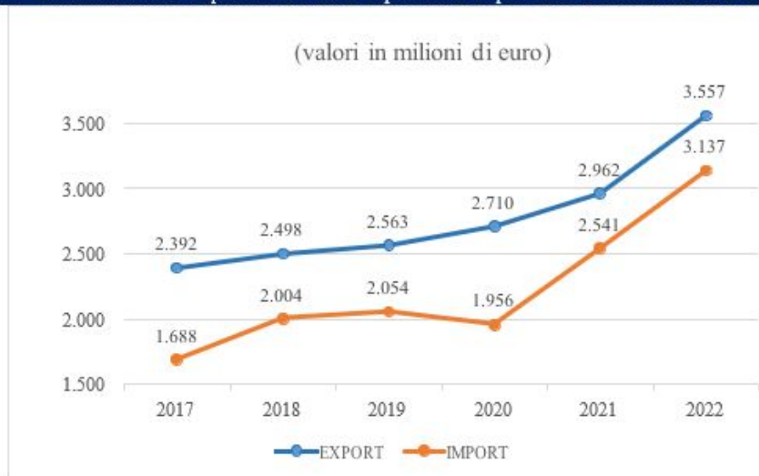
Graf 1 – Andamento delle Esportazioni e delle Importazioni in provincia di Salerno dal 2017 al 2022