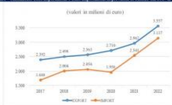
Graf.1 - Andamento delle Esportazioni e delle Importazioni in provincia di Salerno dal 2017 al 2022