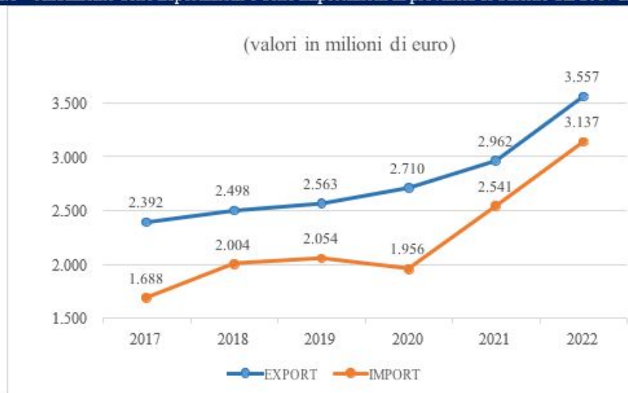
Graf.1 – Andamento delle Esportazioni e delle Importazioni in provincia di Salerno dal 2017 al 2022